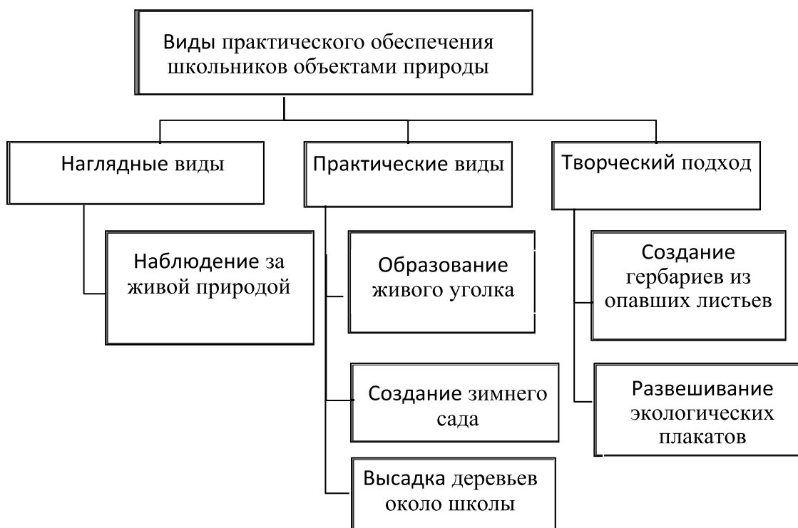
Рис. 1. Виды практического обеспечения школьников объектами природы

мания к отношению школьника к окружающей среде (обществу, работе, окружению, обучению, обязанностям) и к нравственным основам (добро, справедливость, красота).