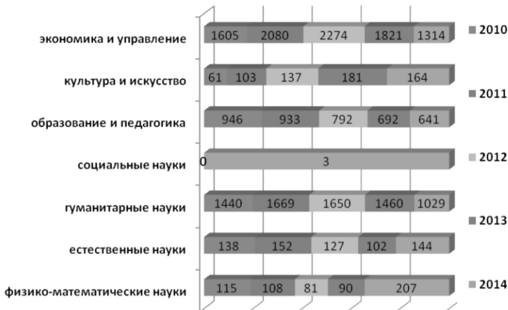
Рисунок 2. Выпуск специалистов с высшим профессиональным образованием государственным образовательными учреждениями по группам специальностей и направлений подготовки в Республике Саха (Якутия) в период с 2010 по 2014гг.

За анализируемый период с 2010 по 2014 гг. наибольший удельный вес занимает выпуск специалистов по направлению подготовки экономика и управление данная категория специалистов испытывает трудности при трудоустройстве это связано с тем, что предложение на данную категорию специалистов в значительной мере больше, чем спрос на региональном рынке труда, в 2014 году по сравнению с 2010 годом уменьшился на 291 человек или на 18,1%, по направлению образование и педагогика наблюдается также уменьшение выпуска специалистов по сравнению с 2010 годом, выпуск сократился на 32.2 %, по другим направлениям подготовки наблюдается увеличение выпуска специалистов, по социальным наукам за анализируемый период выпуск со-