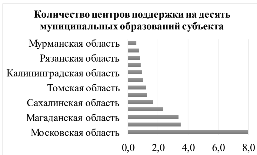
Рис. 2. Количество центров поддержки МСП в субъектах РФ [составлено автором на основе [1]]

2020 года. Так, наблюдался резкий спад активности до 33% в апреле 2020 года, а затем постепенный рост. К декабрю 2022 года количество торговых точек увеличилось уже на 30%. [3]