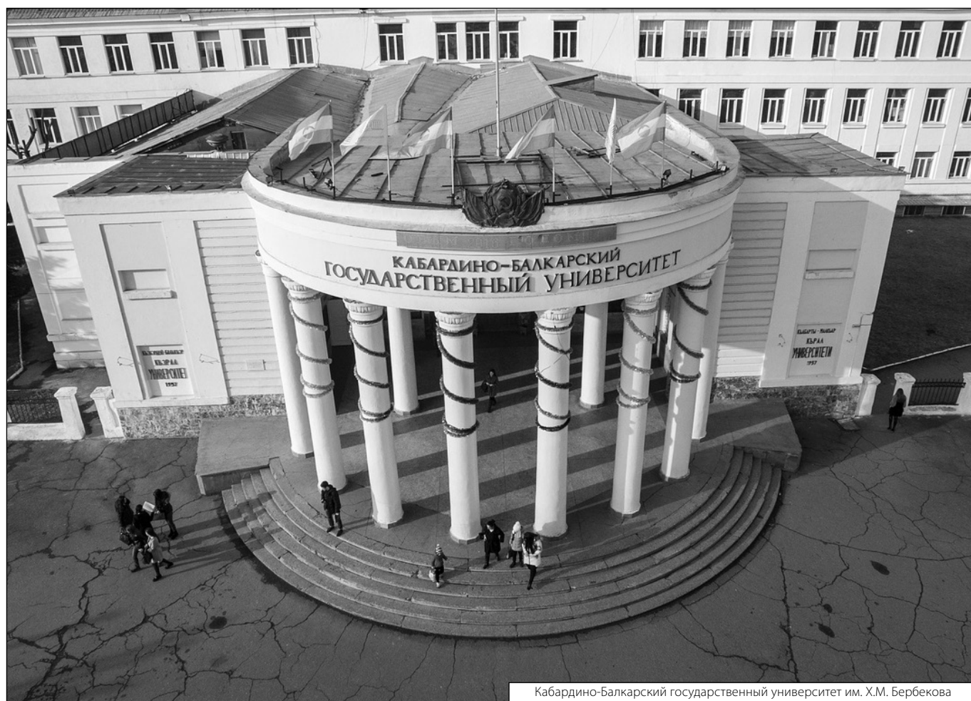
Кабардино-Балкарский государственный университет им. Х.М. Бербекова

© Жерукова Аксана Борисовна (Zherukova65@mail.ru), Тенова Залина Юрьевна (tzu79@mail.ru), Жулюшина Наталья Евгеньевна (nata961521@gmail.com), Тутукова Мадина Рамазановна (madina.tutukova@mail.ru). Журнал «Современная наука: актуальные проблемы теории и практики»