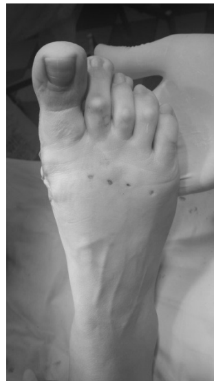
Рис. 1. Вид стоп на операционном столе после проведенных остеотомий Helal 2,3 DMMO 4 слева, DMMO 2,3,4 справа.

пациента выбиралась случайно, примерно половина случаев чрескожных, другая часть открытые операции. Большинство выполненных остеотомий выполнялось симультантно с хирургией 1 луча (SCARF, SD, Артродез 1 пфс).