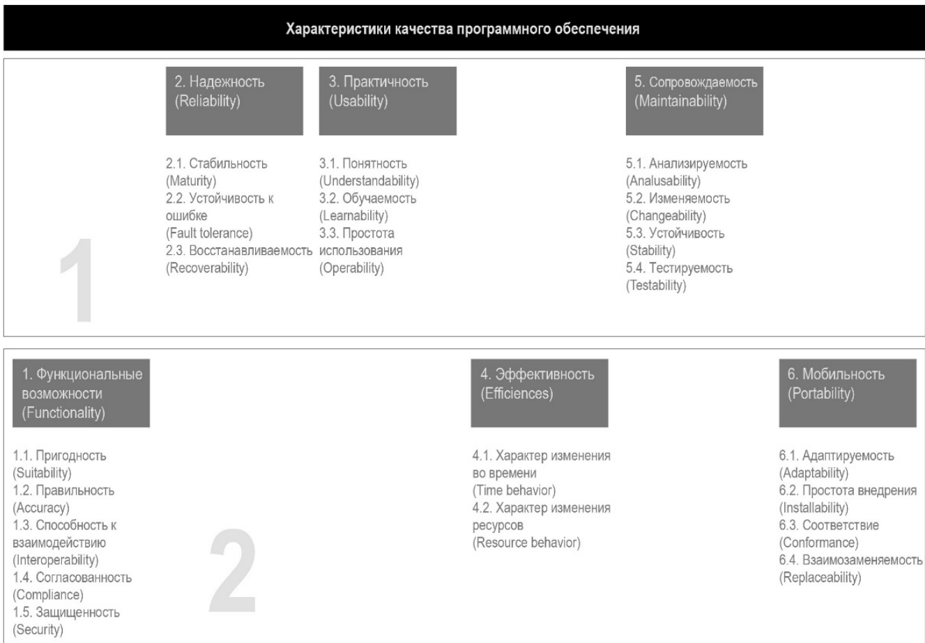
Рис. 2. Показатели качества программно-аппаратного комплекса патрульного автомобиля согласно ГОСТ ИСО/МЭК 9126–2001

Исследования показывают, что использование текстовых коммуникационных устройств снижает риски отвлечения внимания водителя во время вождения. Текст проекционного дисплея более заметен, а кнопки для взаимодействия больше, чем на обычном экране портативного ноутбука, входящего сейчас в стандартную комплектацию патрульного транспортного средства. При этом расположение сенсорного экрана больше соответствует направлению взгляда водителя, необходимому для того, чтобы видеть дорогу перед ним, нежели чем обычное расположение ноутбука, который расположен ниже и правее [3, с. 513]. Соответственно, пользовательский интерфейс программного средства проекционного дисплея должен представлять из себя окно с основными текстовыми данными и крупными элементами навигации.