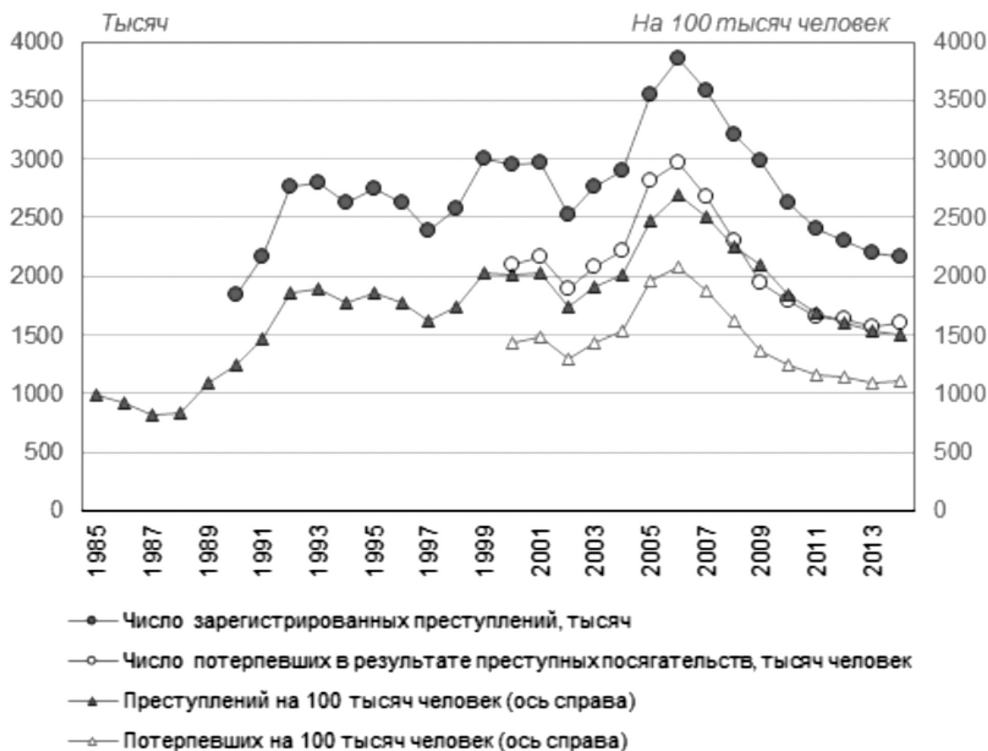
Рисунок 1. Общее число зарегистрированных преступлений и лиц, потерпевших в результате преступных посягательств в РФ, тысяч человек и в расчете на 100 тыс. человек постоянного населения, 1985-2014 г.г. [6]

конца 1980-х г.г. Повышение преступности совпадало с периодами усиления кризисных явлений в социально-экономической жизни общества 1990–1993 г.г. и 1998–1999 г.г., а в периоды относительной стабильности наблюдалось снижение.