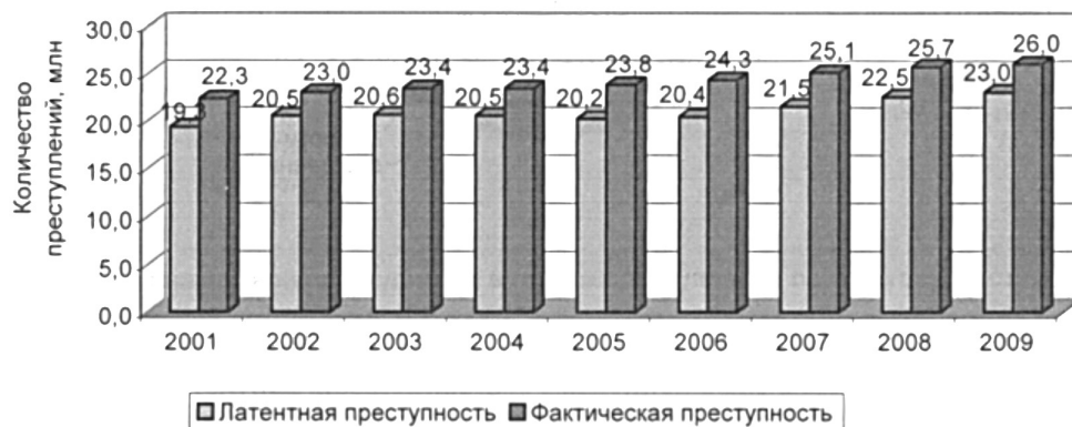
Рисунок 2. Динамика фактической преступности за период 2001-2009 г.г. [3]