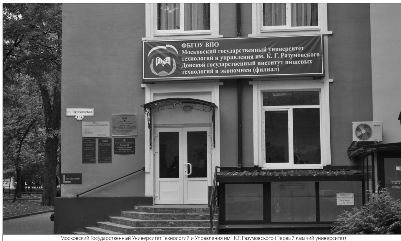
Московский Государственный Университет Технологий и Управления им. К.Г. Разумовского (Первый казачий университет)

Журнал «Современная наука: актуальные проблемы теории и практики»