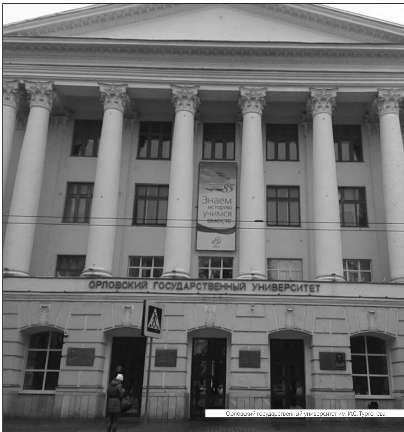
Орловский государственный университет им. И.С. Тургенева

© Максимов Денис Александрович (romrei10@mail.ru), Соломченко Марина Александровна (marin69@yandex.ru), Губанов Эдуард Владимирович. Журнал «Современная наука: актуальные проблемы теории и практики»