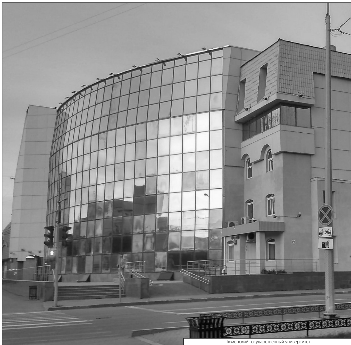
Тюменский государственный университет

Журнал «Современная наука: актуальные проблемы теории и практики»