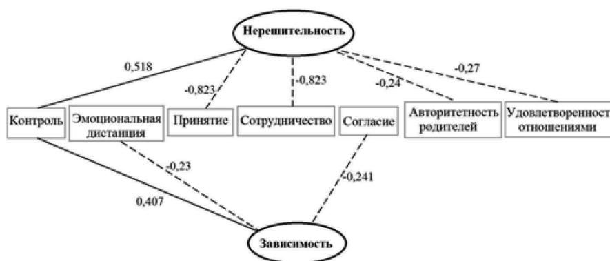
Рис. 2. Корреляционная плеяда показателей профессиональных установок с детско-родительскими отношениями