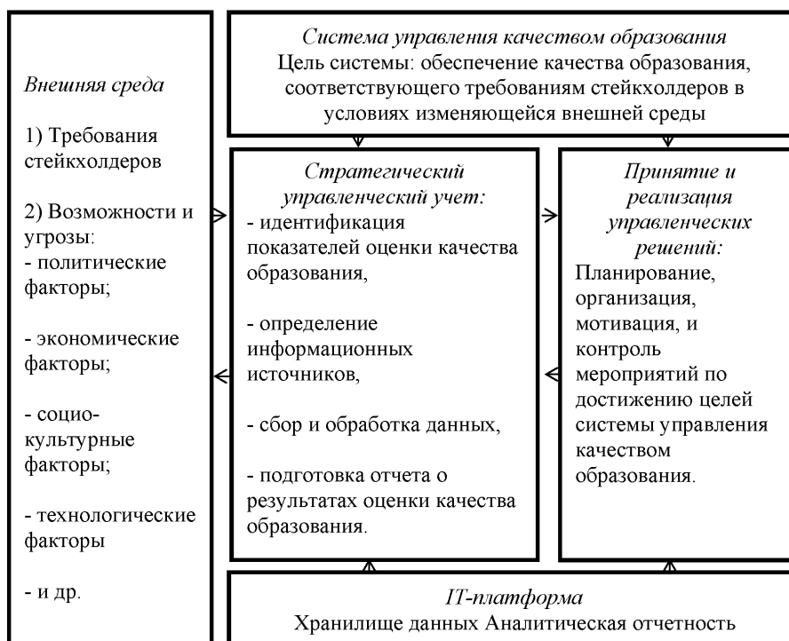
Рис. 2. Модель системы управления качеством образования на основе стратегического управленческого учета

зации в сфере высшего образования. При этом изучению подлежат не только финансовые, но и нефинансовые показатели. Стратегический управленческий учет базируется на значительном числе анализируемых факторов и методик их анализа, при этом требуется адаптация собираемых данных к конкретным целям в области управления качеством [6]. Для обработки большого количества разнородной информации в целях повышения эффективности управленческих решений целесообразно применять современные информационные технологии, в том числе технологии обработки больших данных [7].