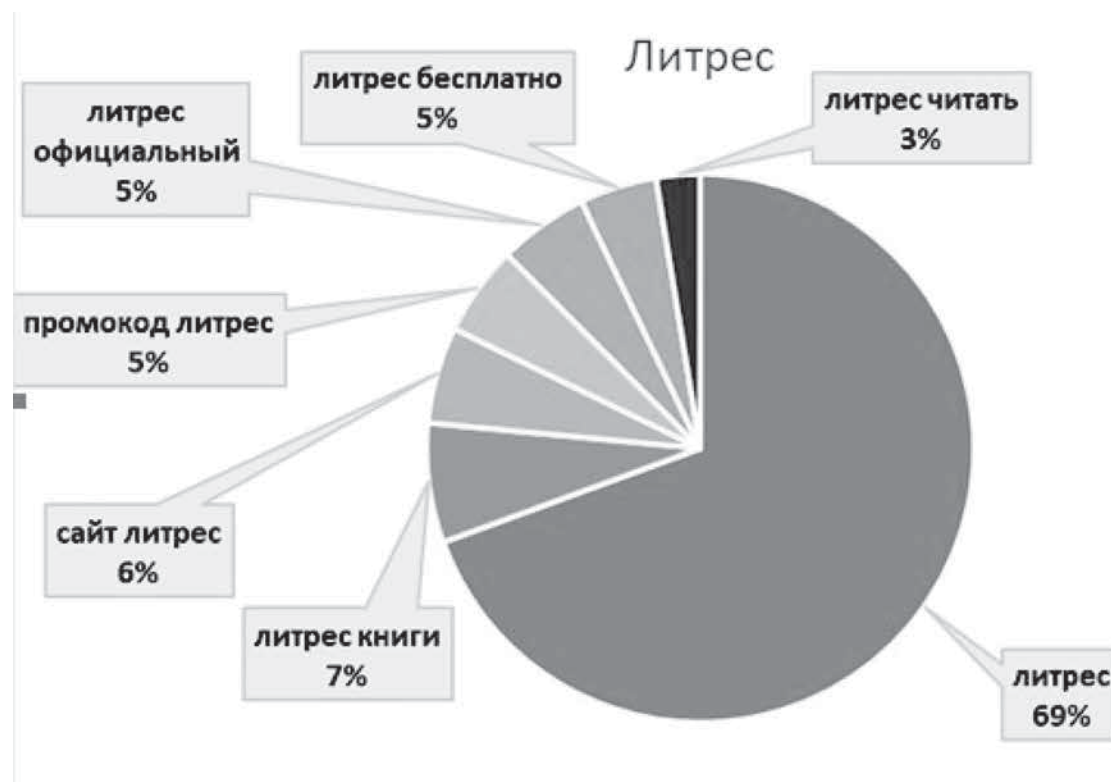
Рис. 2. Запросы парных ключевых слов в сравнении с запросом — ЛитРес (доли в %)

Если рассмотреть по форме предлагаемых произведений, то на первом месте по количеству запросов за ме-