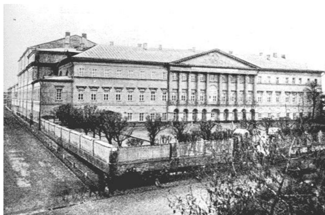
Императорское коммерческое училище

Возвращаясь к требованиям для поступления в средние технические училища, необходимо отметить проблему, которую сначала не учли разработчики "Основных положений о промышленных училищах" 1888 г. [22]. Дело в том, что учащихся, бросавших обучение в реальном училище за год–два до его окончания, чтобы поступить в среднее техническое училище, было очень мало, т.к. окончив курс в реальном училище, они могли поступить в высшее специальное учебное заведение. Именно острый недостаток молодежи, желавшей и имевшей право на поступление в среднее техническое училище, вынуждал принимать туда лиц без соответствующего образования, а именно, окончивших курс городских училищ, по "Поло-