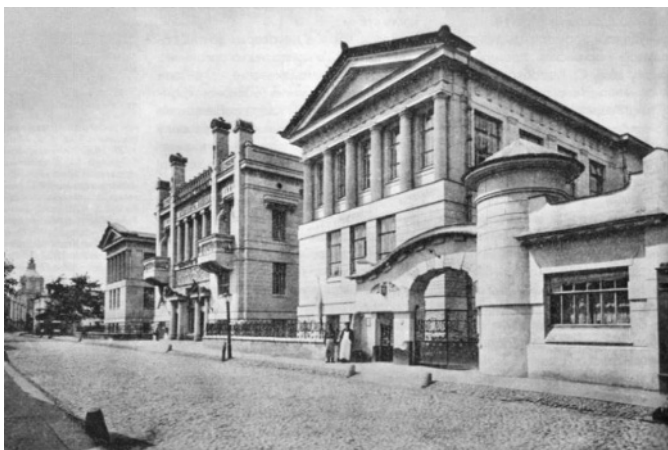
Коммерческое училище имени цесаревича Алексея (1904-1917)

Действительно, в отчете КПУ за 1912 г. отмечается, что "наблюдавшаяся ранее разница между составом учеников среднего технического училища и составом учеников низших технических училищ в настоящее время более или менее сгладилась, т.к. теперь в среднее училище,