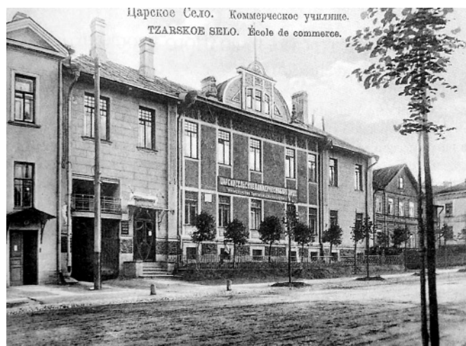
Царскоесельское коммерческое училище (открыто в 1912 г. на Магазейной улице)

Прием учеников в первый и второй классы земледельческого училища проводился ежегодно в августе, а в третий класс – весной, причем сроки подачи заявлений ограничивались для поступающих 25 июля и 1 марта соответственно. Прошение о приеме в училище подавалось на имя директора по установленной форме с приложением