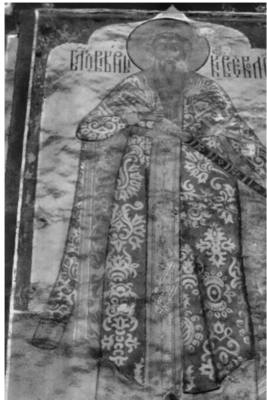
Князь Всеволод Константинович Ярославский

К сожалению, князь Юрий, имея в своем распоряжении достаточно большое по численности войско, не сумел