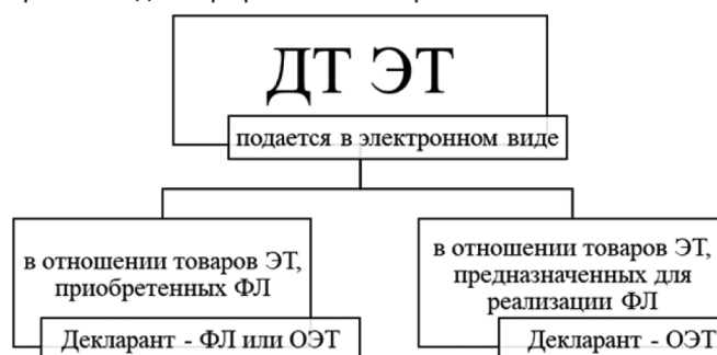
Рис. 2. Виды товаров ЭТ, в отношении которых будет применяться технология электронного декларирования

На рисунке 2 представлены виды товаров ЭТ, в отношении которых будет применяться технология электронного декларирования товаров ЭТ.