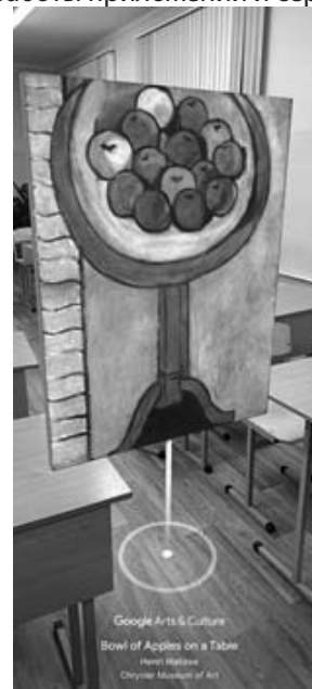
Рис. 3. Виртуальный экспонат, созданный с помощью сервиса Google Art & Culture