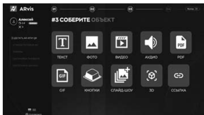
Рис. 1. Интерфейс конструктора дополненной реальности ARvis

интерфейсе, представленном на Рисунке 1.