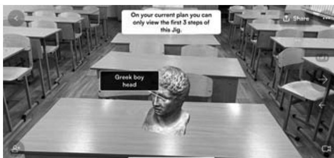
Рис. 2. Виртуальный экспонат, созданный с помощью приложения JigSpace

Вторая группа работала с инструментом Art Project сервиса Google Art & Culture, обучающиеся выбрали и подготовили описание картин известных художников. Пример виртуальной картины представлен на Рисунке 3. На данном этапе обучающимся было предложено самостоятельное из-