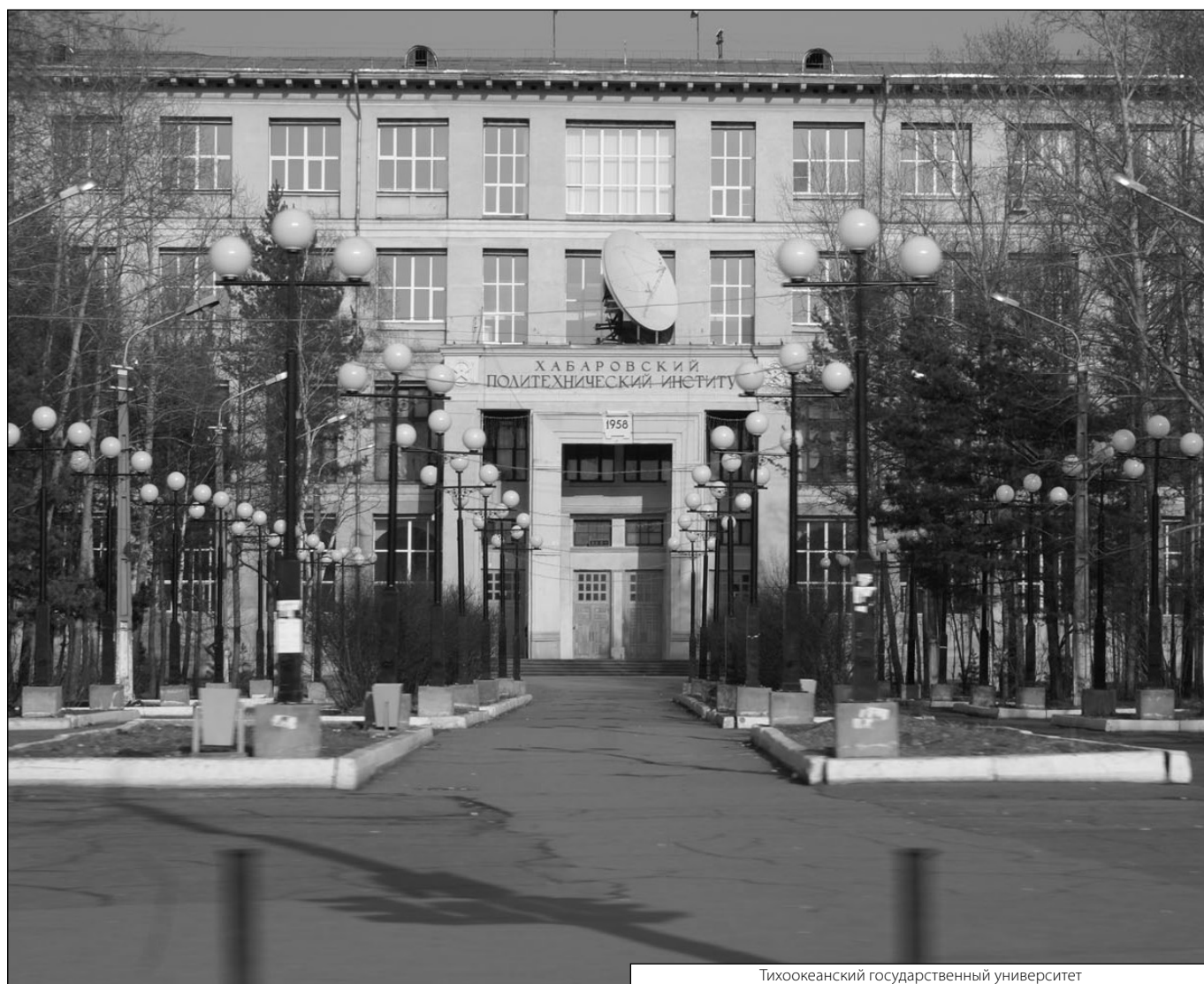
Тихоокеанский государственный университет

Журнал «Современная наука: актуальные проблемы теории и практики»