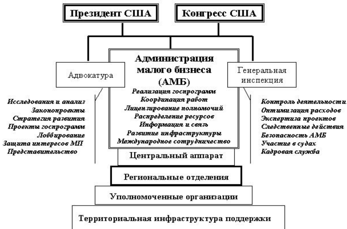
Рис. 3. Структура системы государственной поддержки МСП в США[4]

при осуществлении НИОКР до защиты интересов МСП на всех уровнях власти. Помимо АМБ в США существует немало разнообразных программ, направленных на развитие различных сегментов МСП, причем особое значение придается развитию инновационного предпринимательства, что обусловлено высокой эффективностью капиталоотдачи инновационных разработок и относительно высоким количеством патентов, выданных на одного работника МСП. Также в США высоко развита практика венчурного инвестирования, которая позволяет инновационным предприятиям разработать и довести до ума свой продукт и выйти на рынок, что было бы невозможно без крупных инвестиций извне. Структура системы государственной поддержки МСП в США представлена на рисунке 3.