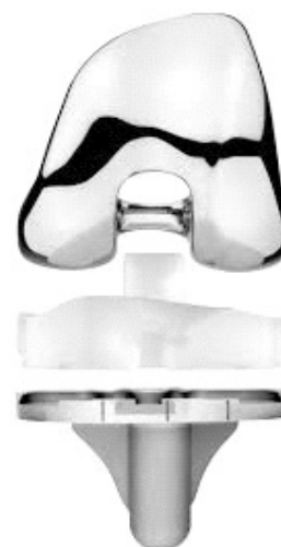
Рисунок 2. Эндопротез коленного сустава с замещением задней крестообразной связки — PS

Эндопротез следующего поколения связанности — ССК, condylar constrained knee (VVK/varus-valgusknee) — эндопротез повышенной стабильности в области мыщелков бедренной кости. Это механически полусвязанный эндопротез, который обеспечивает стабильность во фронтальной плоскости (смещения на варус-вальгус), в сагиттальной плоскости, а также небольшую ротационную стабильность [6]. Полусвязанные конструкции эндопротезов коленного сустава впервые