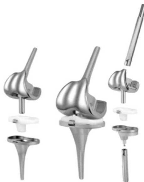
Рис. 4. Связанный эндопротез коленного сустава

Cholewinski P. и соавторы исследовали результаты первичного эндопротезирования коленного сустава протезами типа ССК. Показаниями к использованию данного вида эндопротеза были выраженная деформация