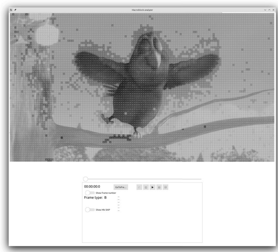
Рис. 2. Интерфейс разработанной программы для анализа макроблоков. Желтым выделены макроблоки типа «Skip»