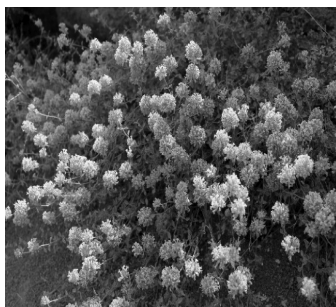
Ziziphora clinopodioides Lam.