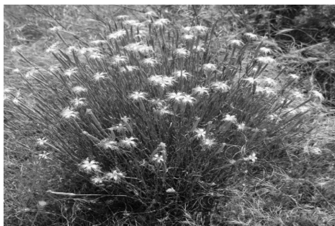
Dianthus crinitus Sm.