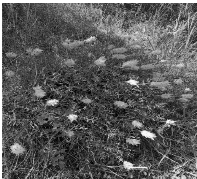
Onobrychis ebenoides Boiss.