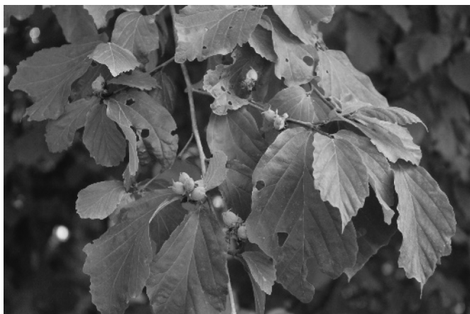
Parrota persica L.