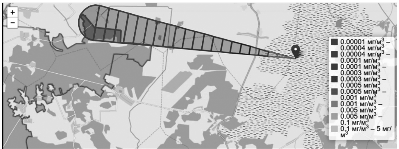
Рис. 1. Моделирование переноса загрязняющих веществ в воздухе

Проблема аварийных сбросов является глобальной, и касается всей планеты вследствие возможного распространения на огромные расстояния. Даже для госу-