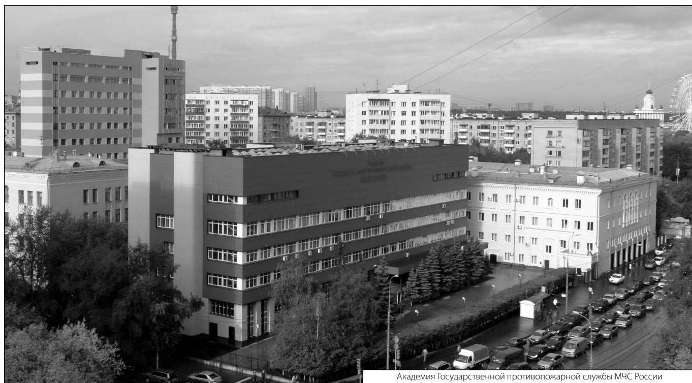
Академия Государственной противопожарной службы МЧС России

Журнал «Современная наука: актуальные проблемы теории и практики»