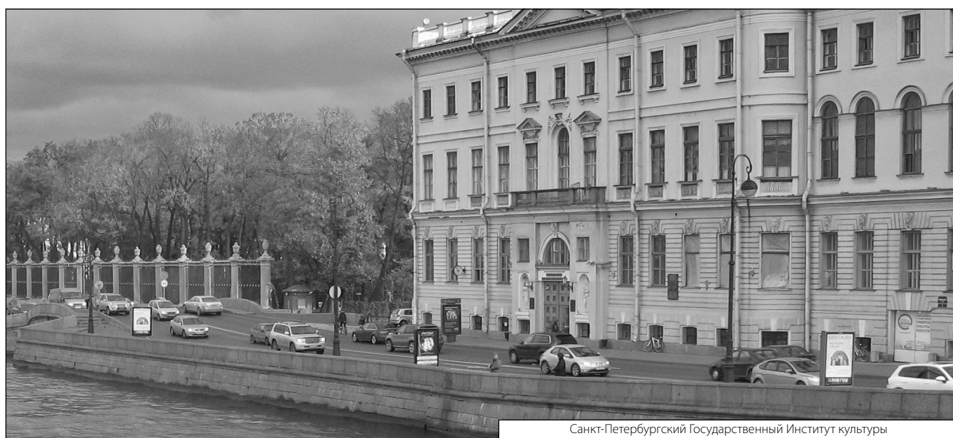
Санкт-Петербургский Государственный Институт культуры

Журнал «Современная наука: актуальные проблемы теории и практики»