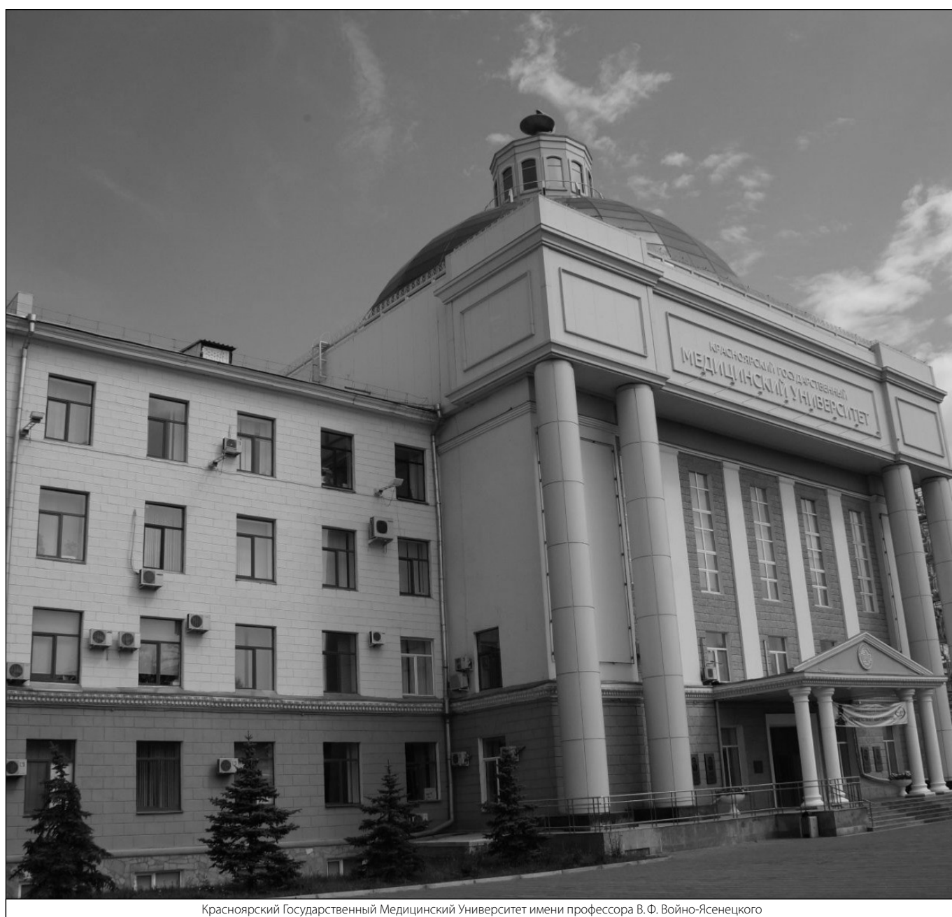
Красноярский Государственный Медицинский Университет имени профессора В. Ф. Войно-Ясенецкого

© Еремеева Валентина Анатольевна (valentinkaeremeeva123456@gmail.com). Журнал «Современная наука: актуальные проблемы теории и практики»