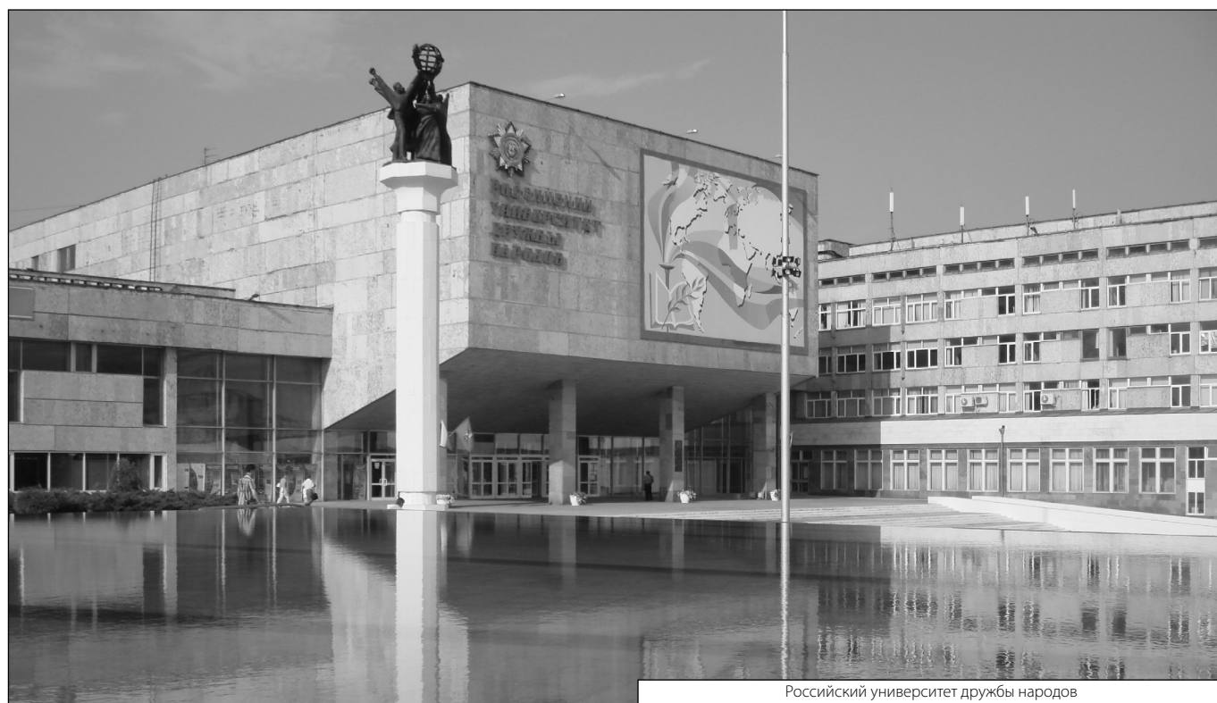
Российский университет дружбы народов

© Дударева Марианна Андреевна ( marianne.galieva@yandex.ru ). Журнал «Современная наука: актуальные проблемы теории и практики»