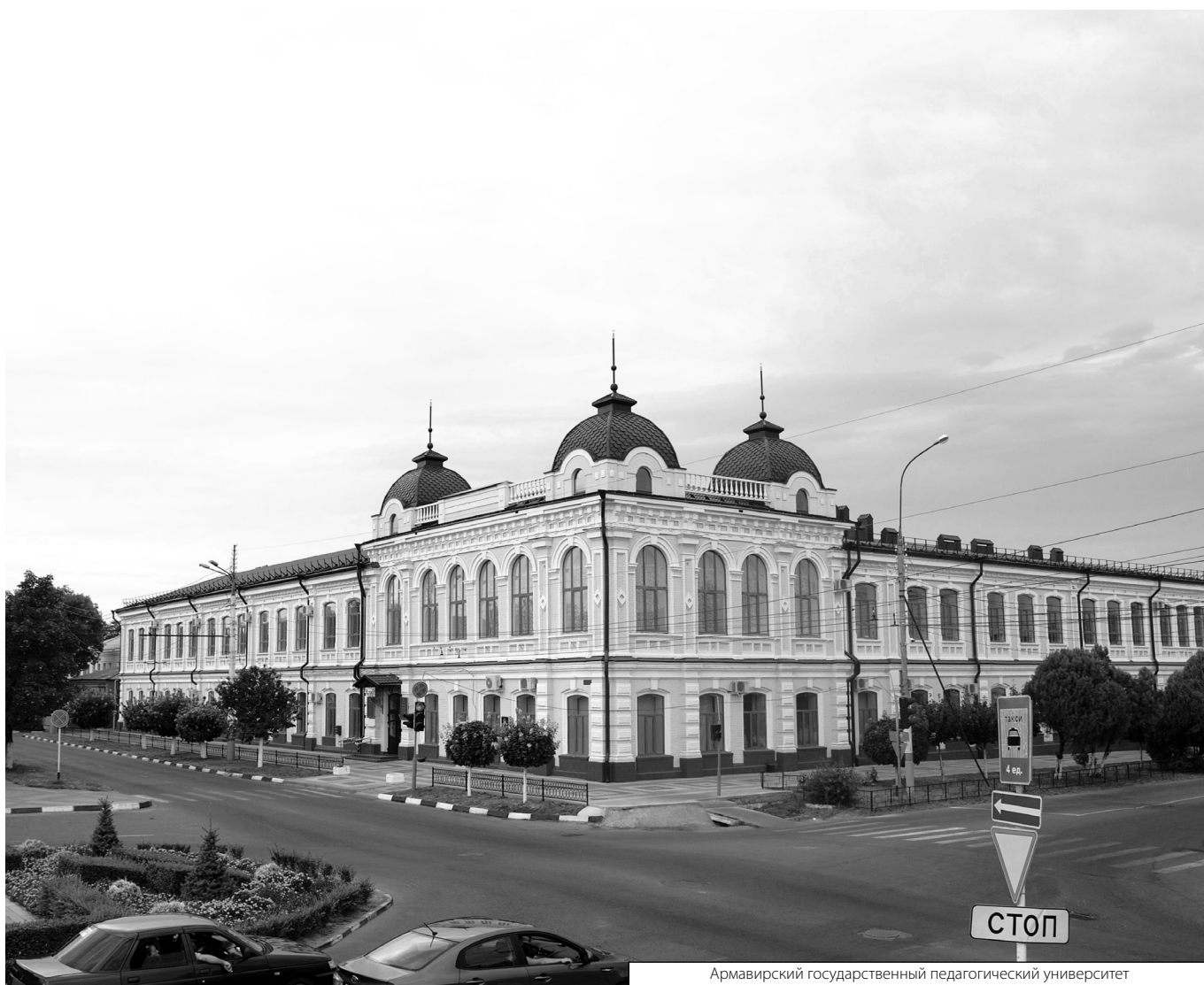
Армавирский государственный педагогический университет

Журнал «Современная наука: актуальные проблемы теории и практики»