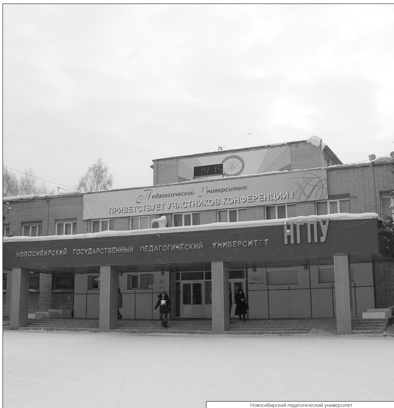
Новосибирский педагогический университет

Журнал «Современная наука: актуальные проблемы теории и практики»