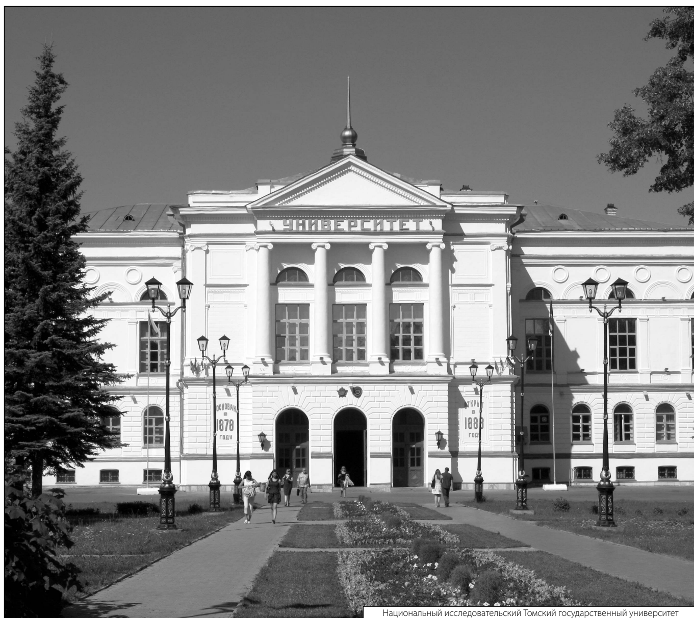
Национальный исследовательский Томский государственный университет

Журнал «Современная наука: актуальные проблемы теории и практики»