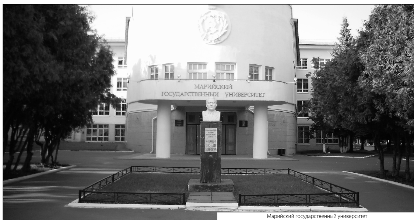
Марийский государственный университет

Журнал «Современная наука: актуальные проблемы теории и практики»