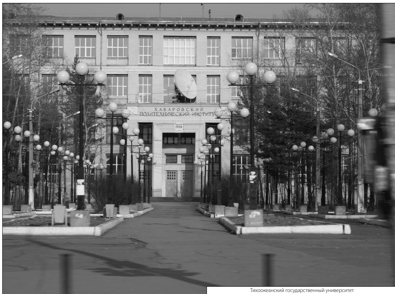
Тихоокеанский государственный университет

Журнал «Современная наука: актуальные проблемы теории и практики»