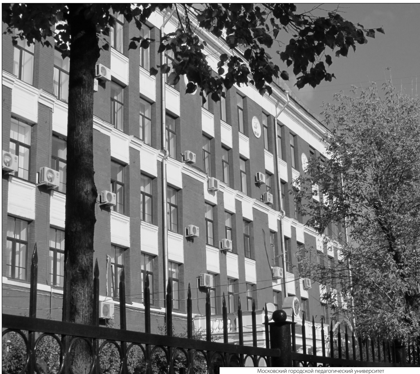
Московский городской педагогический университет

Журнал «Современная наука: актуальные проблемы теории и практики»