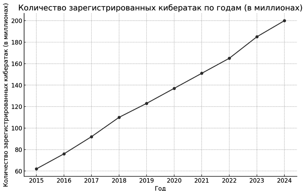
Рис. 1. Число кибератак по годам, данные Symantec, Check Point, Gartner, Statista Распределение различных типов кибератак на сессии за 2024 год