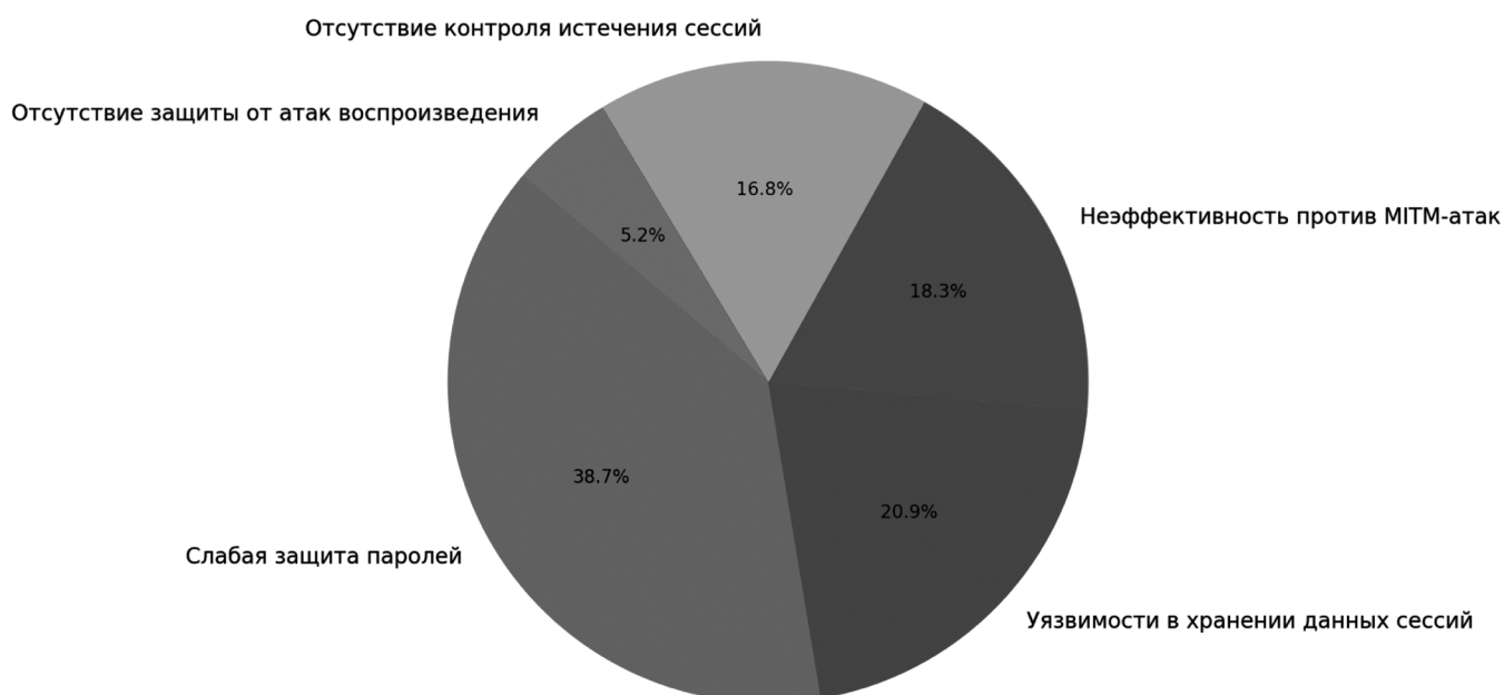
Рис. 4. Наиболее частые причины успешных кибератак (2021–2023)

Многофакторная аутентификация (MFA) — это классический, но по-прежнему актуальный способ усилить защиту за счет комбинирования нескольких факторов аутентификации. В дополнение к паролю применяются одноразовые коды, биометрические данные или аппа-