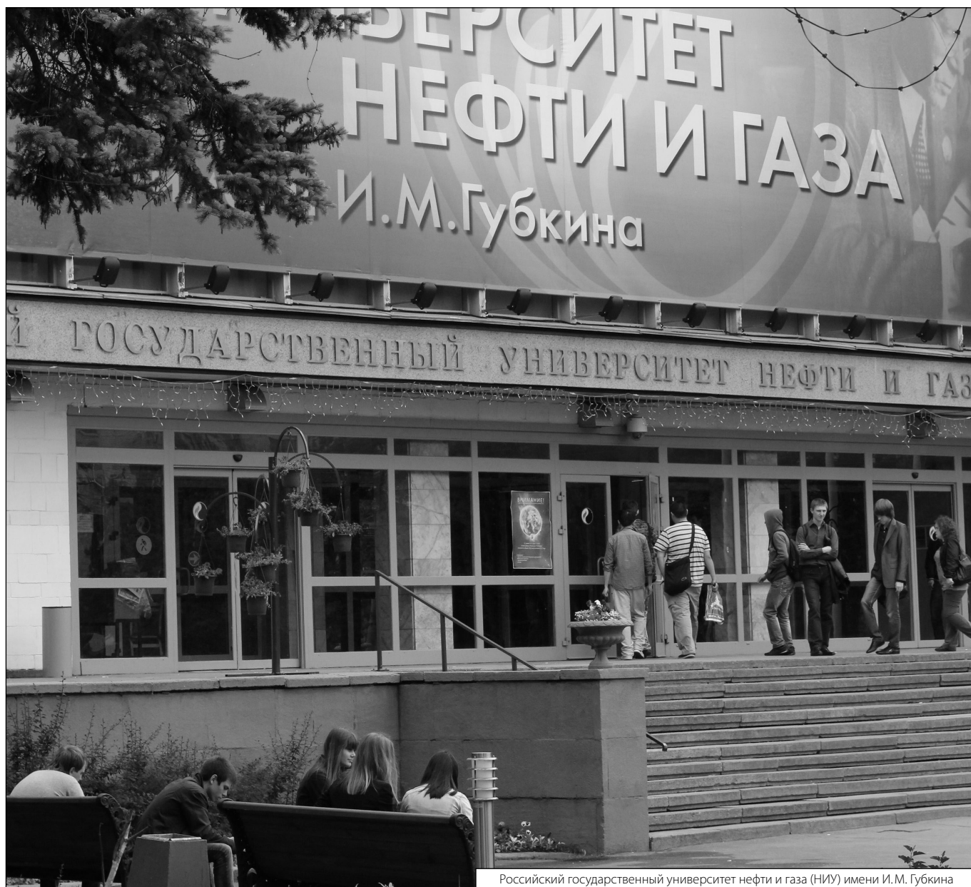
Российский государственный университет нефти и газа (НИУ) имени И. М. Губкина

Журнал «Современная наука: актуальные проблемы теории и практики»