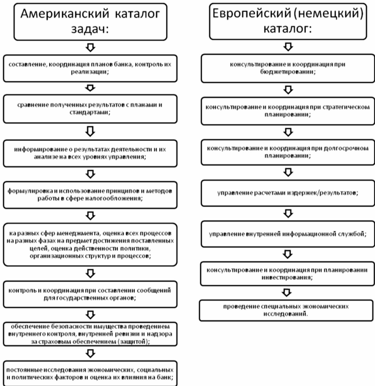
Рис. 2. Элементы системы контроллинга

В настоящее время контроллинг внедряется в крупные российские организации такие, как: ОАО "Ростелеком", ОАО "РЖД", ОАО "Автоваз", ОАО "Лукойл", ОАО "Газпром-нефть" и др. Направления использования представлены в табл.2. Необходимо отметить, что применение контроллинга охватывает различные сферы предпринимательства, вносит большой вклад в налаживание и улучшение действий по систематическому контролю за деятельностью всех подразделений предприятий