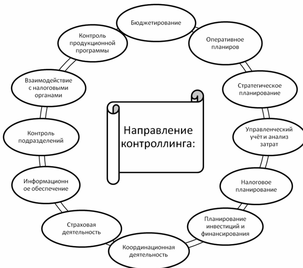
Рис. 1. Направления деятельности в сфере контроллинга