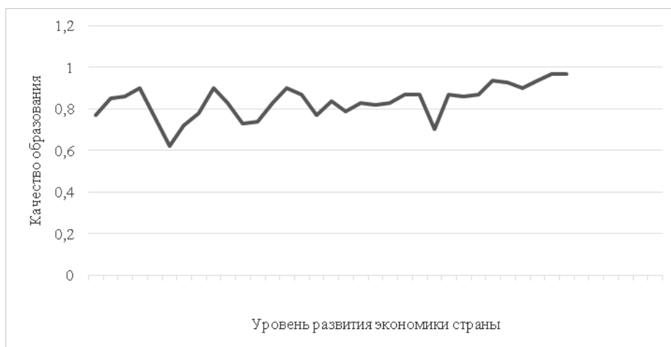
Рис. 2. Зависимость индекса человеческого развития от индекса образования согласно данным, представленным Human Development Report to focus on inequality

Данные, представленные на рисунке 1, позволяют нам сделать частный вывод об отсутствии прямой взаимосвязи между качеством образования и качеством жизни. Так, в качестве примера можно привести Объединенные Арабские Эмираты (ОАЭ), которые согласно данным аналитического центра The Legatum Institute занимают 10 позицию в рейтинге по уровню экономического развития экономики и при этом лишь 39-е место по качеству образования, в то время как Исландия, чей рейтинг экономического развития составляет 35-е место, занимает 9-е по качеству предоставления образовательных услуг.