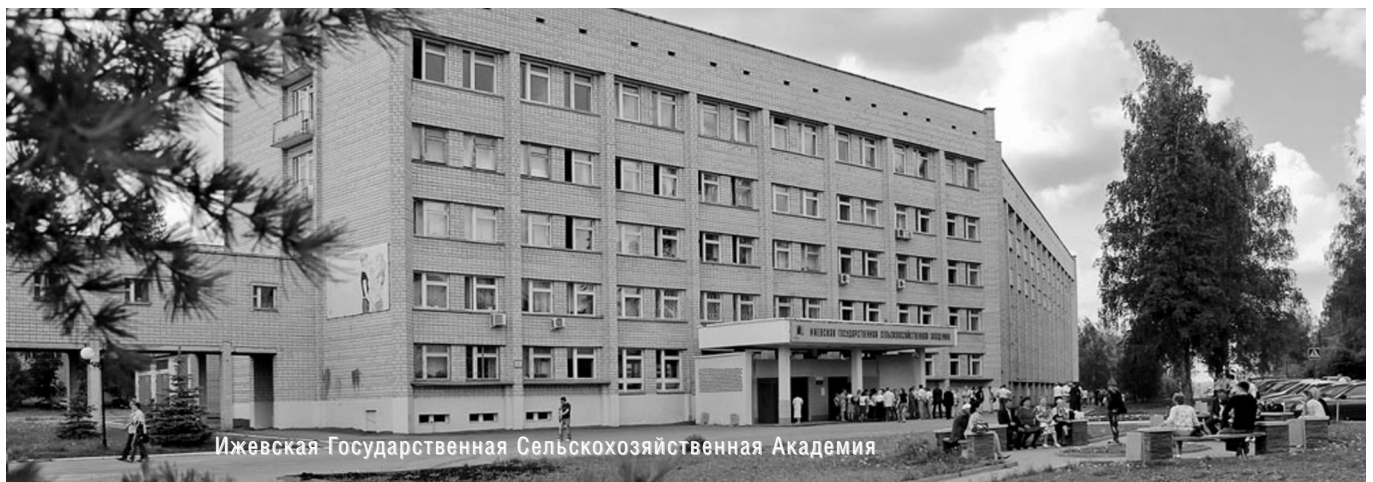
Ижевская Государственная Сельскохозяйственная Академия

© А.Ф. Асадуллин, ( airat055@mail.ru ), Журнал «Современная наука: Актуальные проблемы теории и практики»,