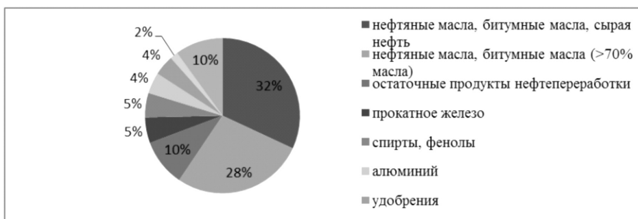
Рис.2. Структура экспорта Венесуэлы в МЕРКОСУР,%, 2014 год.

Импорт Венесуэлы из стран-участниц МЕРКОСУР в основном состоит из продуктов питания. Так, 10% всего импорта занимает мясо коров, чуть меньше приходится на мясо других животных. 4,5% импорта приходится на ввоз медикаментов ( см. Рис.3).