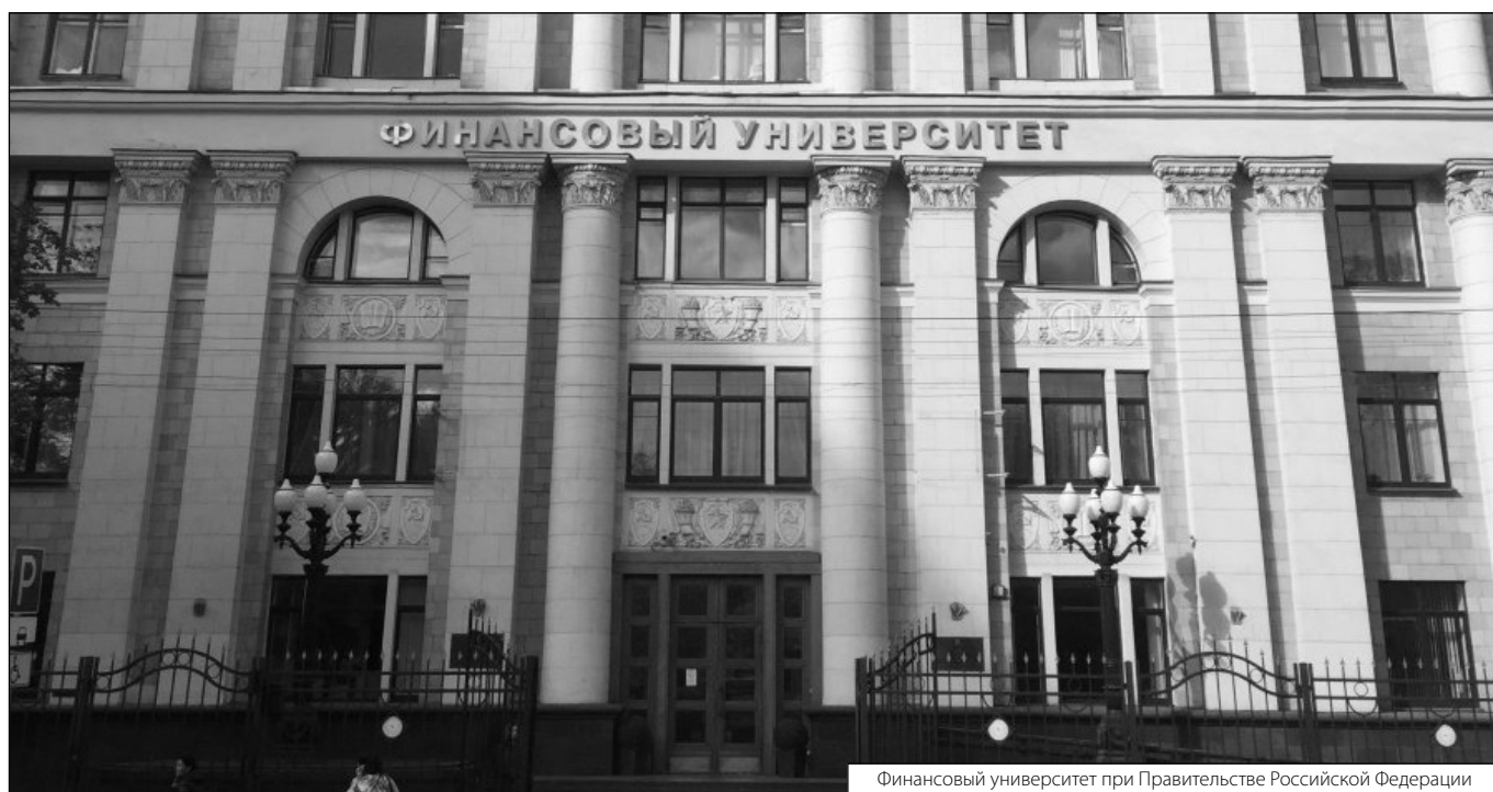
Финансовый университет при Правительстве Российской Федерации

© Топильская Арина Александровна (arinaaleksandrovnatopilskaya@gmail.com). Журнал «Современная наука: актуальные проблемы теории и практики»