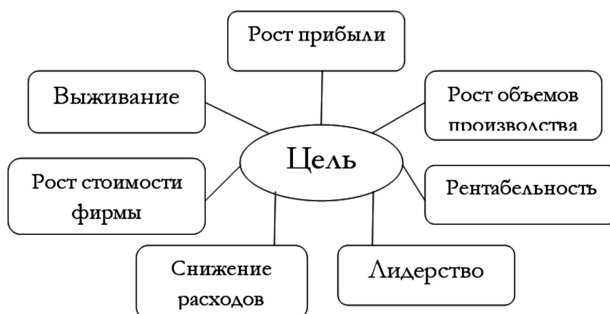
Рисунок 2. Цели и задачи финансового менеджмента.

Субъект управления представляет собой совокупность финансовых инструментов, методов, технических средств, а также специалистов, определенных в финансовую структуру, которые осуществляют целенаправленное функционирование объекта управления.