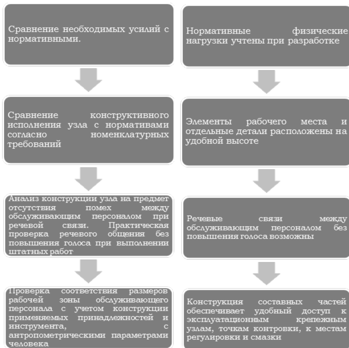
Рис. 3. Алгоритм оценки организации рабочих мест