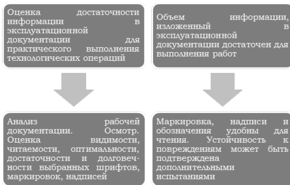
Рис. 1. Алгоритм предоставления информации