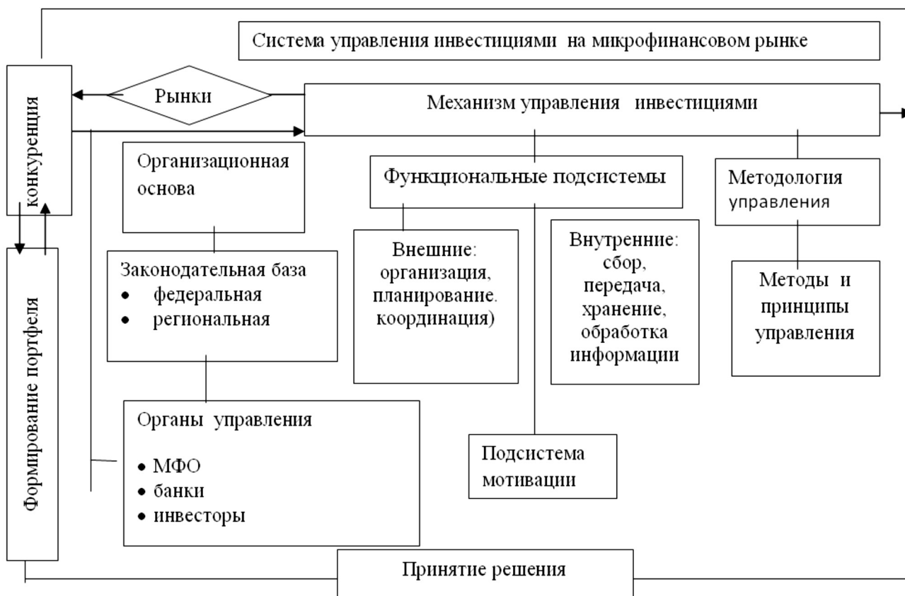
Рисунок 2. Структура системы управления инвестициями на микрофинансовом рынке.