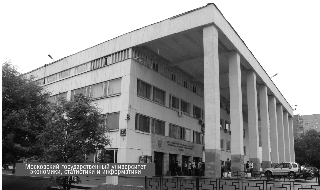
Московский государственный университет экономики, статистики и информатики

© А.А. Хамидов, ( hamidov_aa@list.ru ), Журнал «Современная наука: Актуальные проблемы теории и практики»,