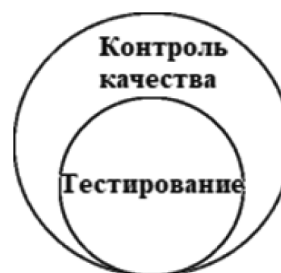
Рис. 1: Соотношение между понятиями «тестирование» и «контроль качества»

Тестирование программного обеспечения согласно ISO/IEC TR 19759:2005 — это процесс исследования, тестирования программного обеспечения, целью которого является проверка соответствия между фактическим поведением программы и ее ожидаемым поведением на окончательном наборе тестов, выбранном конкретным (рис. 1).