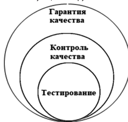
Рис. 2: Взаимосвязь между ОК, КК и тестированием

Взаимосвязь между обеспечением качества, контролем качества и тестированием показана на рис. 2. Деятельность по обеспечению качества включает установление стандартов и процессов, контроль качества и выбор соответствующих инструментов.