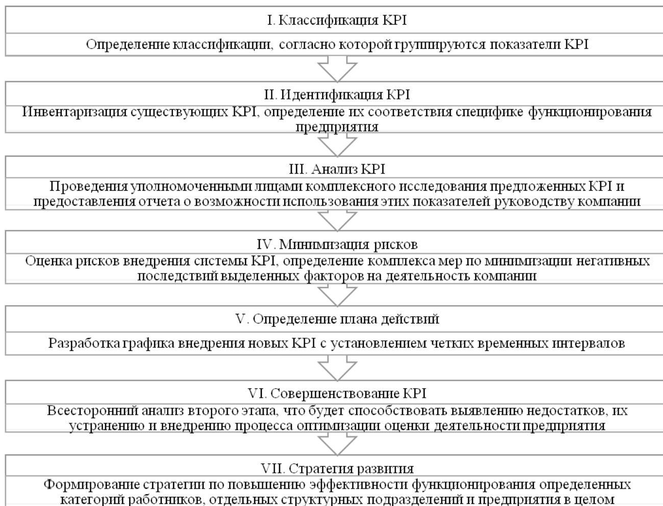
Рис. 1. Основные этапы введения КРІ [3]

благодаря КРІ каждый сотрудник понимает, за что и какой размер вознаграждения он может получить. В рамках КРІ каждый работник имеет четко определенные персональные задачи, а также установленные сроки их выполнения, благодаря чему компания имеет возможность контролировать его деятельность [2].