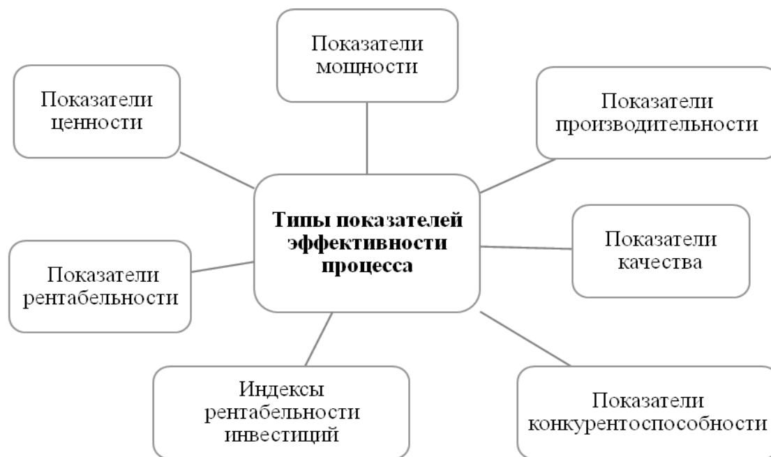
Рис. 2. Типы показателей эффективности процесса [7]

рованной, то есть позволяет всесторонне исследовать ключевые бизнес-процессы. На рисунке 2 представлены основные типы показателей, на основе которых строится конкретная система KPI предприятия.