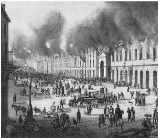
Неизвестный литограф. Пожар 28 и 29 мая 1862 г. в Санкт-Петербурге.

Теперь ясно, что "оттепель" закончилась далеко не в 1881 году, с воцарением Александра III, а гораздо раньше. Когда же?