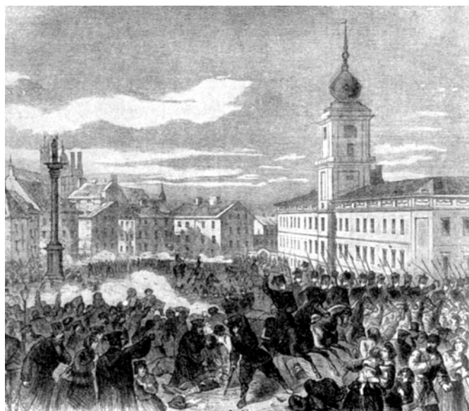
Польское восстание 1863–1864 гг.

Восстание, начавшееся в январе 1863 и окончательно подавленное к маю 1864 года, ничего не дало для польской самостоятельности. Но оно сильно изменило обстановку внутри России. Консервативная партия торжествовала поражение в.к. Константина, и в его лице – всех реформаторов. Либеральная политика Константина в Польше окончилась провалом, тогда как грубая солдатская работа пришедшего ему на смену Михаила Муравьёва обеспечила восстановление порядка.