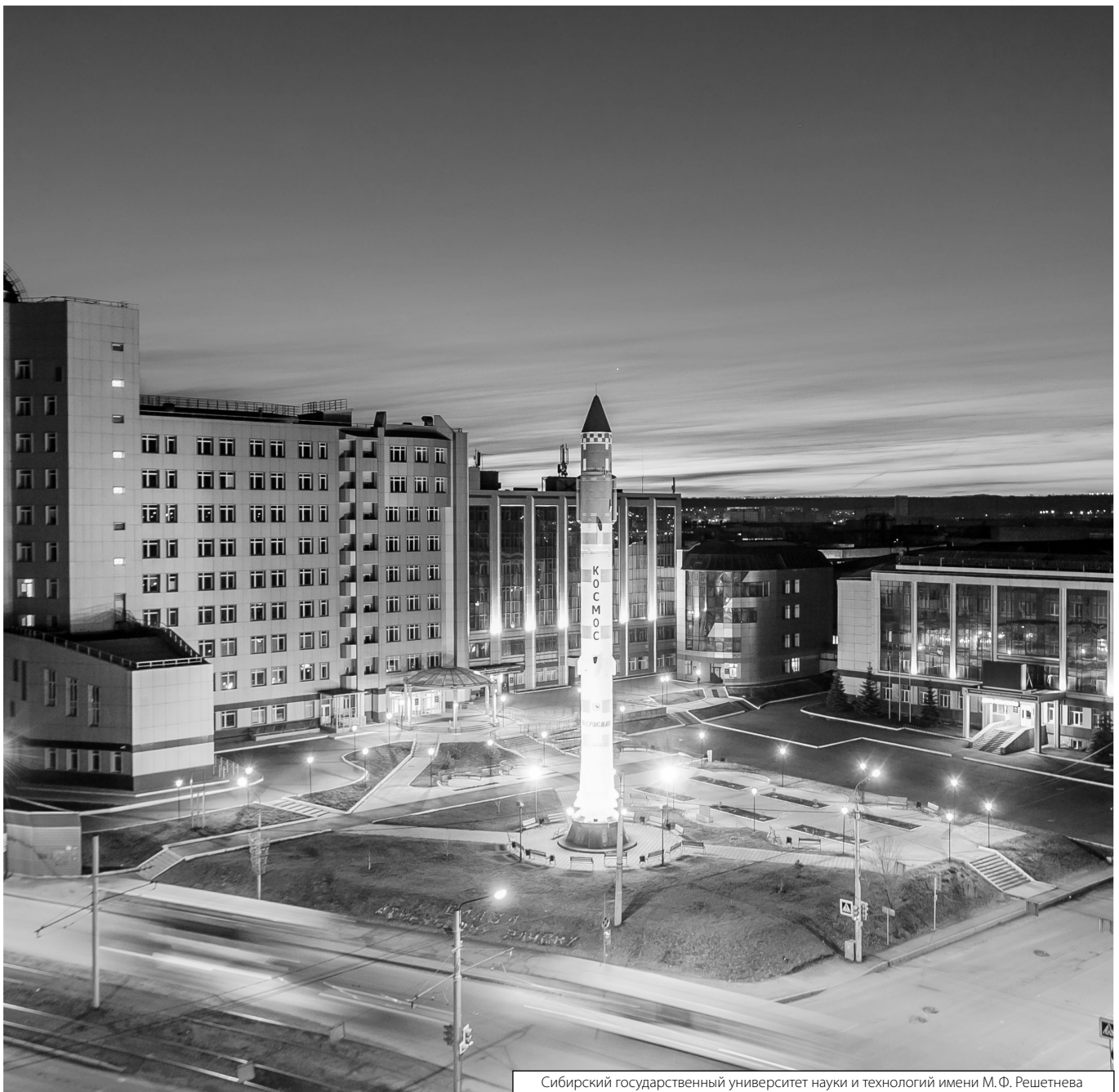
Сибирский государственный университет науки и технологий имени М. Ф. Решетнева

© Майнашева Софья Олеговна ( maynasheva95@yandex.ru ), Огородникова Юлия Владимировна ( grand_espada24@mail.ru ), Болотова Ольга Валерьевна ( emgikimama@mail.ru ), Горбунов Эрик Вячеславович ( eric.gorbunov@bk.ru ). Журнал «Современная наука: актуальные проблемы теории и практики»