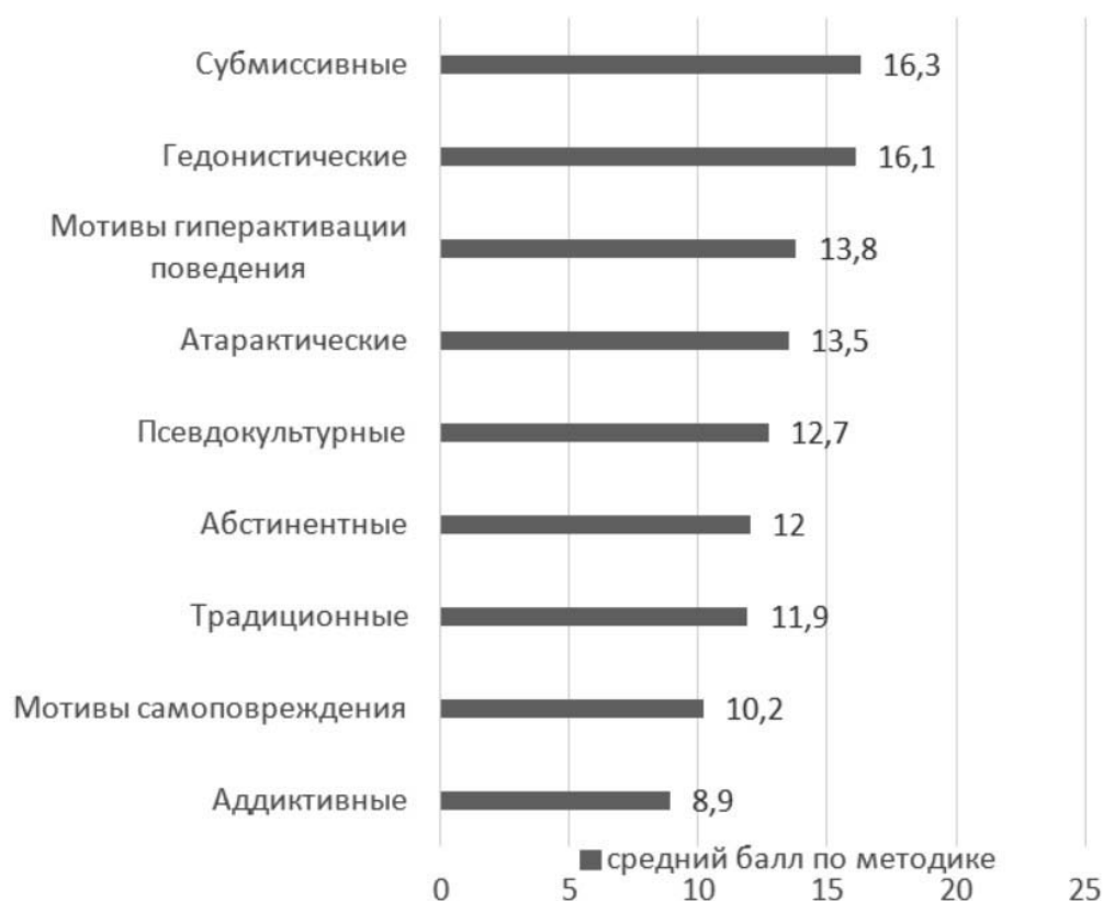
Рис. 2. Показатели выбора мотивов употребления наркотиков (методика «Мотивы употребления наркотиков» И.В. Аксютца)

отсутствии патологической мотивации, свидетельствующей об осознаваемом влечении к наркотическим веществам.