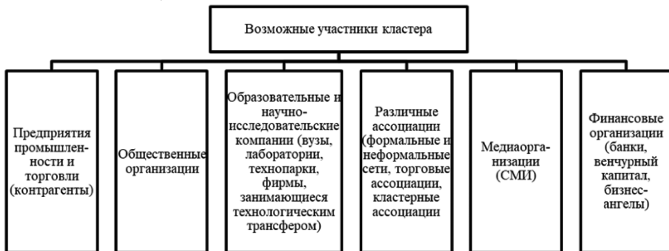
Рис. 2. Возможные участники кластера