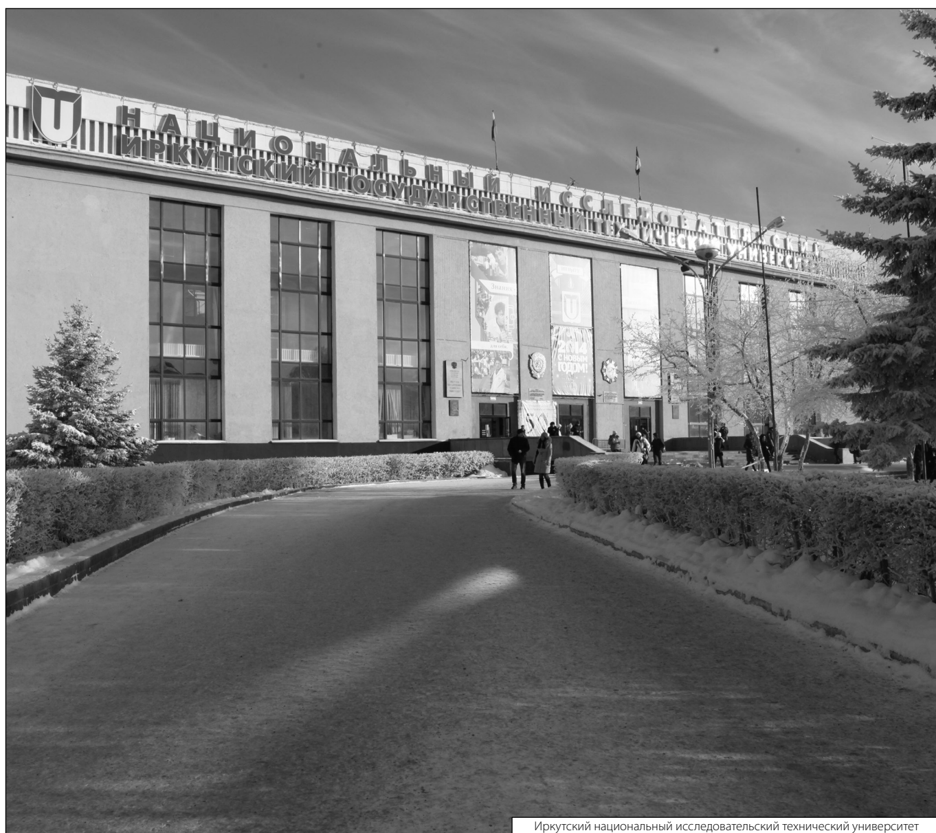
Иркутский национальный исследовательский технический университет

© Бутакова Светлана Викторовна ( 5962svetlana.butakova@mail.ru ), Кочерыгина Елена Викторовна, Вершинина Светлана Эдуардовна, Журнал «Современная наука: актуальные проблемы теории и практики»