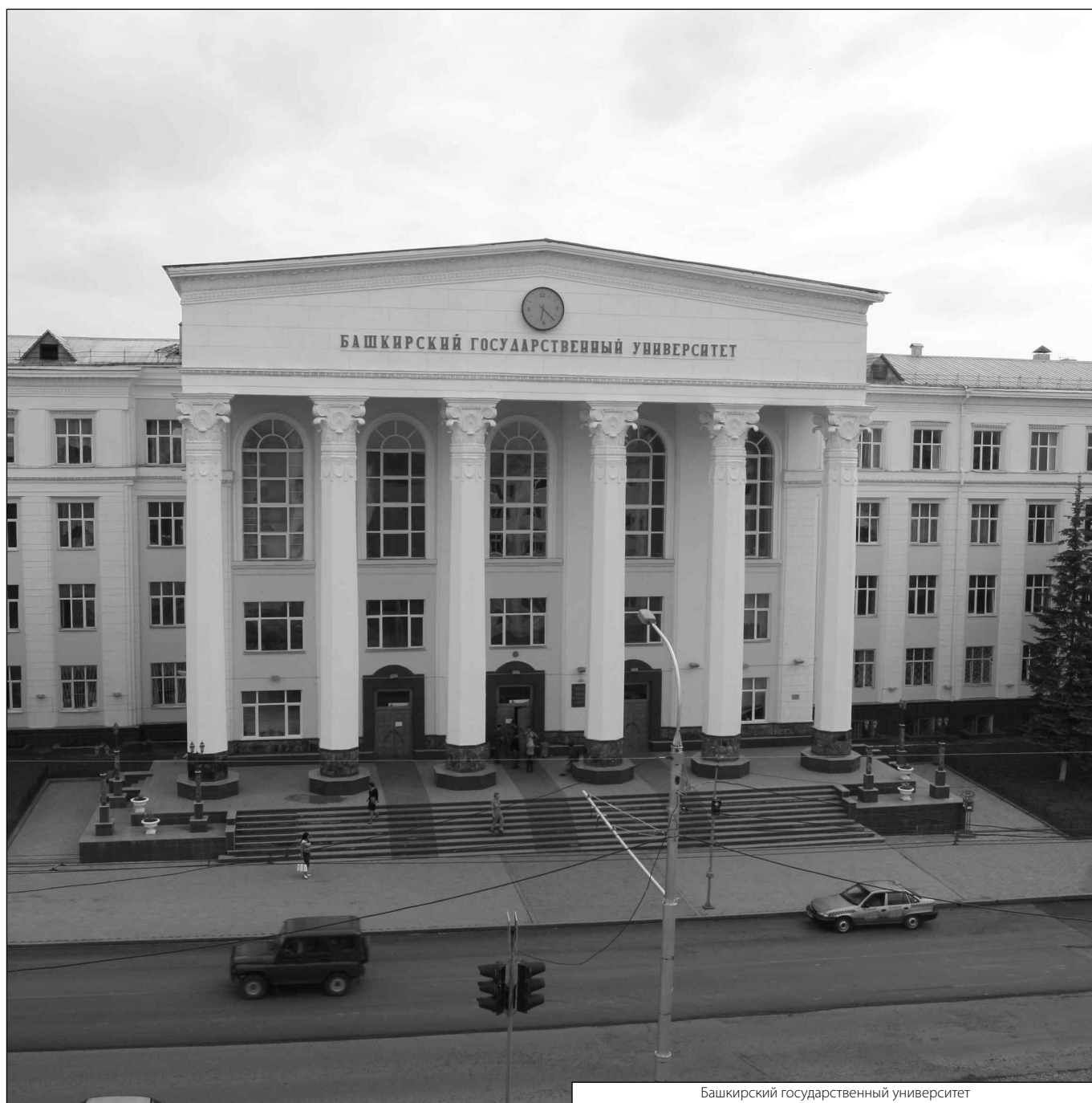
Башкирский государственный университет

© Нурутдинов Азамат Анварович ( dodger86@yandex.ru ), Ямалетдинова Клара Шаиховна ( clara-yk@yandex.ru ), Ахмадеев Азат Валерьевич ( kafedra.bzhd@mail.ru ), Баранова Мария Сергеевна ( mariya.baranova.2014@bk.ru ), Мухаметшин Эмиль Азатович ( Mukhametshin.e.a@gmail.com ). Журнал «Современная наука: актуальные проблемы теории и практики»