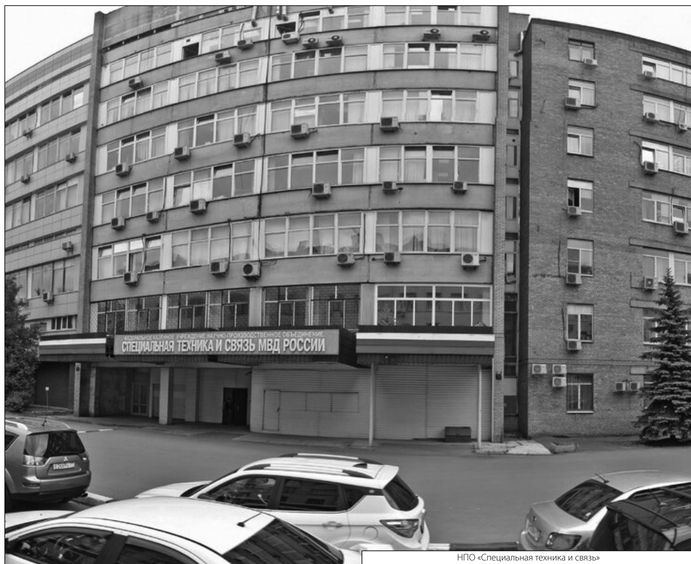
НПО «Специальная техника и связь»

Журнал «Современная наука: актуальные проблемы теории и практики»