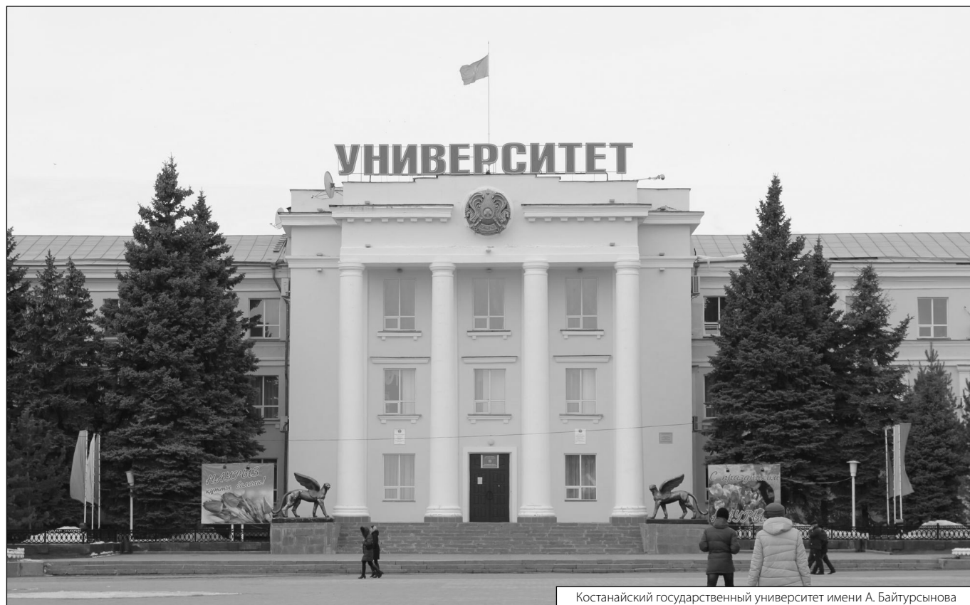
Костанайский государственный университет имени А. Байтурсынова

Журнал «Современная наука: актуальные проблемы теории и практики»