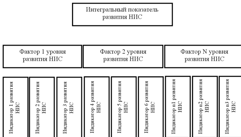
Рисунок 2. Существующая модель построения рейтингов уровня инновационного развития НИС.

Источник информации: составлено автором по итогам исследования.