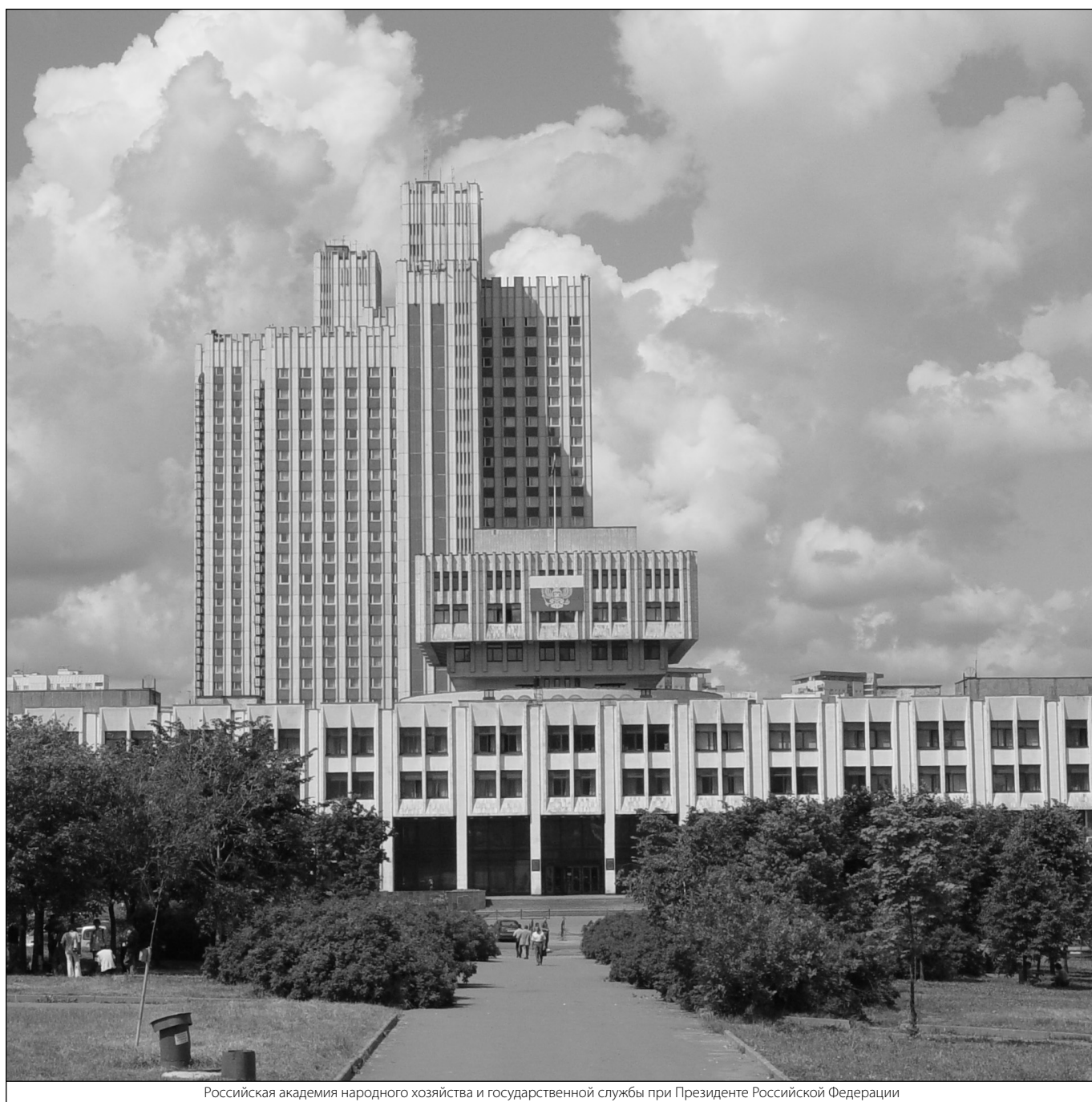
Российская академия народного хозяйства и государственной службы при Президенте Российской Федерации

Журнал «Современная наука: актуальные проблемы теории и практики»