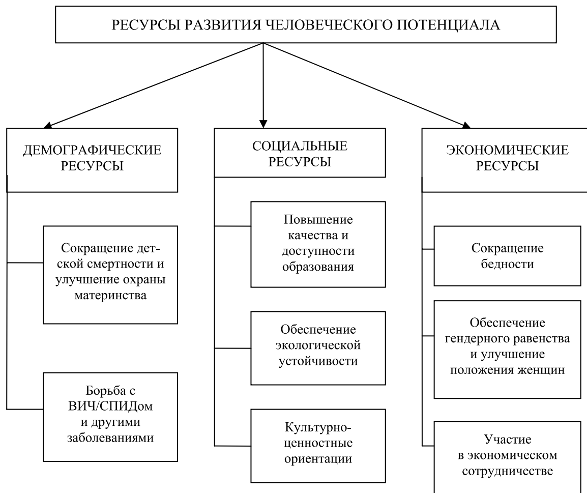
Рисунок 3. Ресурсы развития человеческого потенциала

характеристиками, и ресурса нормального функционирования и развития национальной экономики. Феноменология человеческого потенциала обладает спецификой, представленной на рис. 1.