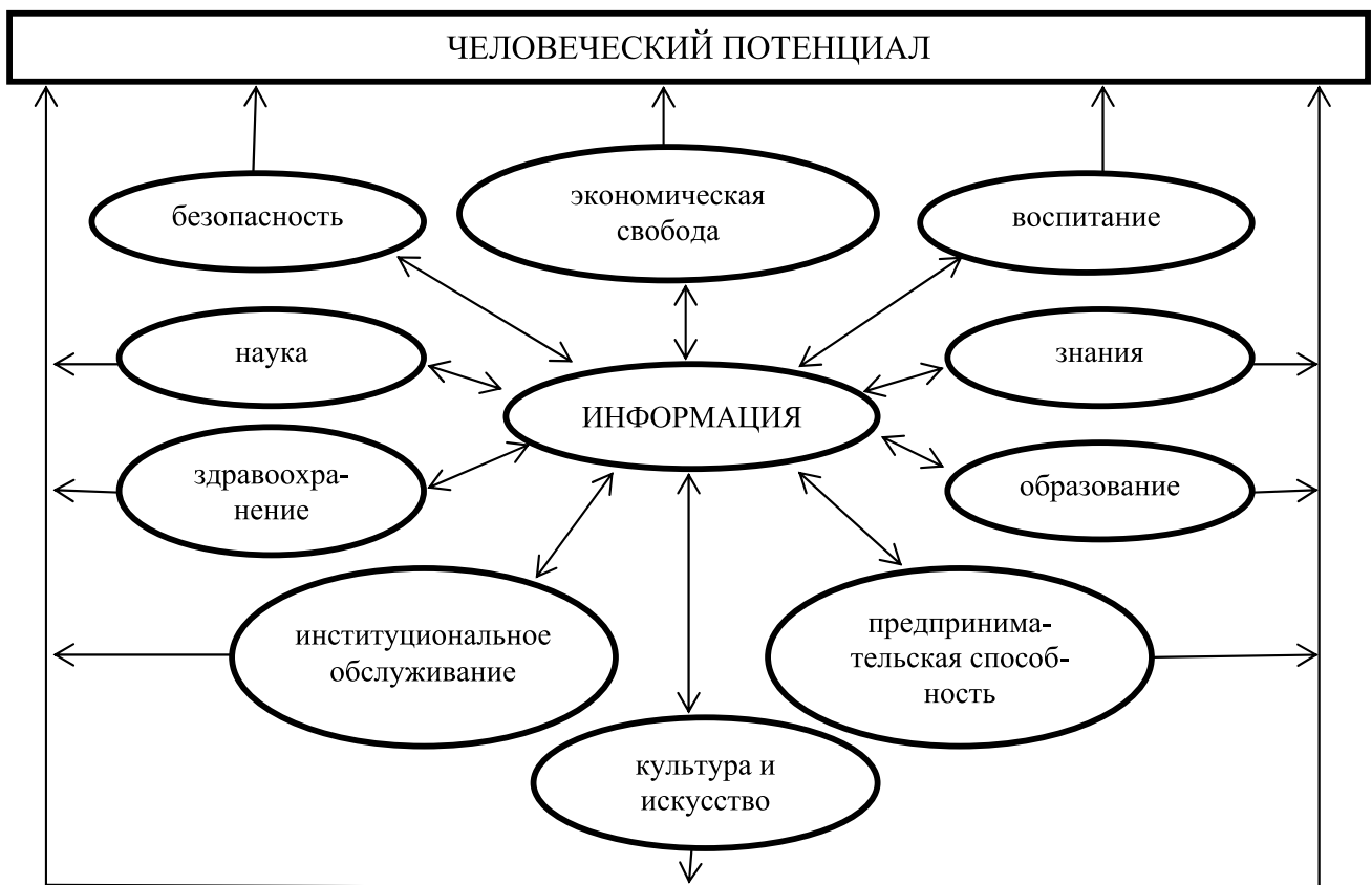
Рисунок 2. Информация – движущая сила человеческого потенциала

и организации, т.е. все субъекты рыночных отношений. Способность экономики создавать и эффективно использовать человеческий потенциал все в большей мере определяет экономическую силу нации, ее благосостояние. Открытость общества для импорта разнообразных знаний, идей и информации, способность экономики продуктивно их перерабатывать – вот от чего