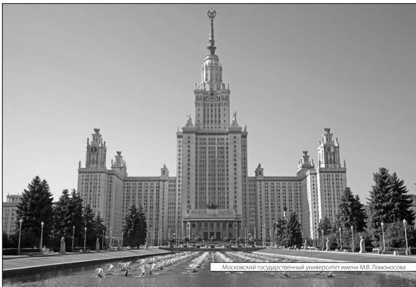
Московский государственный университет имени М.В. Ломоносова

Журнал «Современная наука: актуальные проблемы теории и практики»