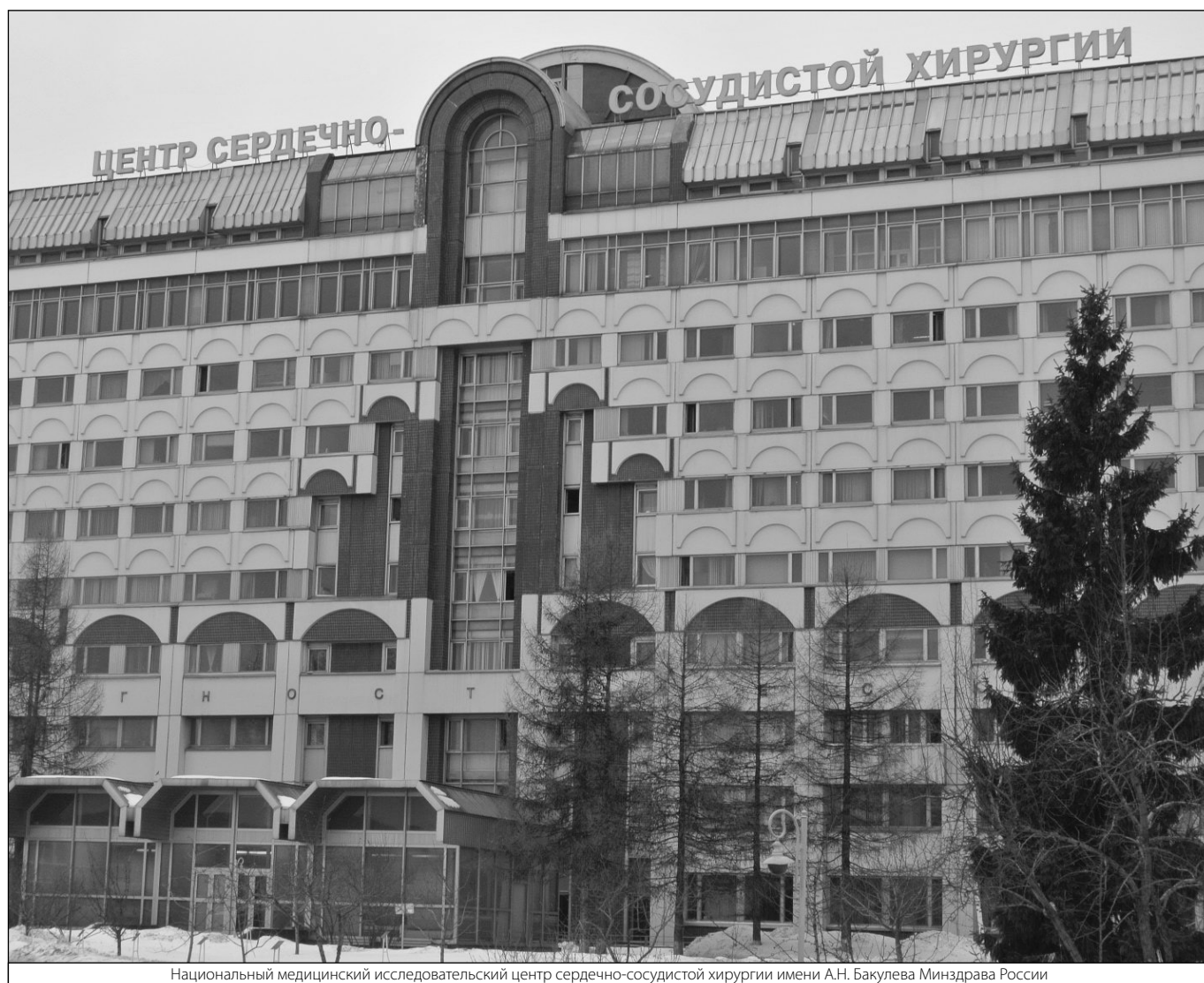
Национальный медицинский исследовательский центр сердечно-сосудистой хирургии имени А.Н. Бакулева Минздрава России

© Жалилов Адхам Кахрамонович ( Jalilov_adham@mail.ru ), Мерзляков Вадим Юрьевич, Ключников Иван Вячеславович, Скопин Антон Иванович, Мамедова Севиндж. Журнал «Современная наука: актуальные проблемы теории и практики»