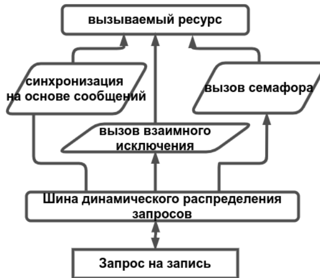
Рис. 1. Модель синхронизации запросов на основе сообщений с динамическим распределением запросов

Экспоненциальный закон, определяющий Пуассоновский поток событий (9):