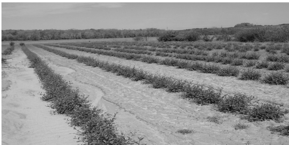
Рис. 2. Участок производственного питомника с посадочным материалом кустарников кизильника блестящего (Волгоградская область)

* BAUER RAINSTAR E 41 — компактный агрегат современной оросительной техники